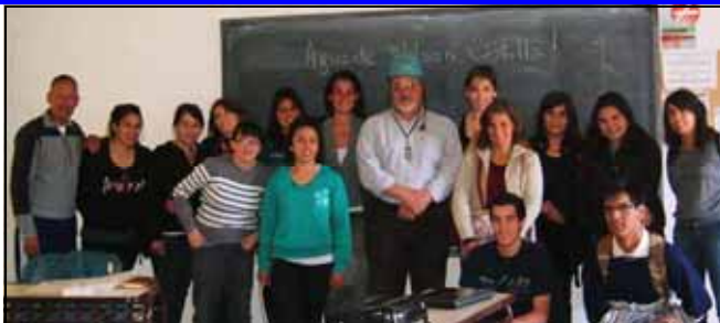
En octubre se realizó en el IES-9018 un curso Nivel I, iniciación a la Espeleología y quedaron pendientes las prácticas de campo, que se llevarán a cabo en Caverna de Las Brujas en 2014