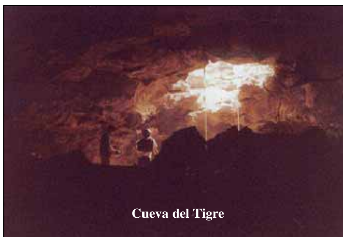
Cueva del Tigre