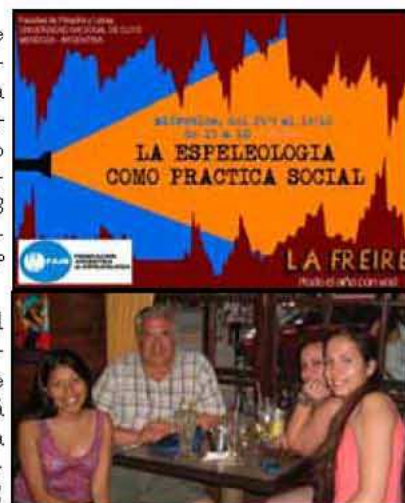
Con miembros de la Agrupación La Freire, UNC, organizando el viaje a Las Lajas

Ya está circulando entre los miembros y allegados de la FAdE el proyecto de Memoria 2015 y se está confeccionando el balance de ese ejercicio, para ser tratado en asamblea, que posiblemente sea en Semana Santa, aprovechando la ocasión para "cuevear", como ya es costumbre en este tipo de encuentros. En la oportunidad podrán participar los espeleólogos de San Luis, que esta vez no pueden hacerlo