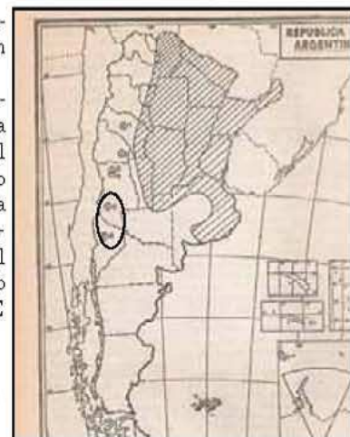
El mapa muestra en un óvalo a la Cuenca Neuquina, que contiene a las Cavernas de Las Brujas y Cuchillo Curá. En ambas hay fauna de clima húmedo que ya no vive en la superficie, aunque sus parientes son abundantes en el litoral húmedo de nuestro país y el Amazonas. Algunos de ellos son "relictos", pero otros son "fósiles vivientes" de fauna completamente desaparecida de la superficie terrestre.