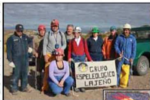
El Grupo GELA y el logo del V Congreso de agosto próximo... El Ave Fénix es la espeleología neuquina que renace