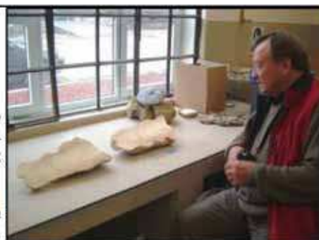
Brook en el Museo Juan Olsacher de Zapala, luego del corte de la muestra

Finalmente el día 18 de mayo nos envió el siguiente informe preliminar, que publicamos en el idioma original, para evitar errores de traducción: