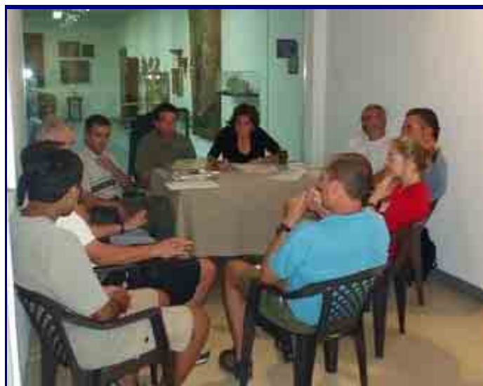
Mesa Redonda de educación