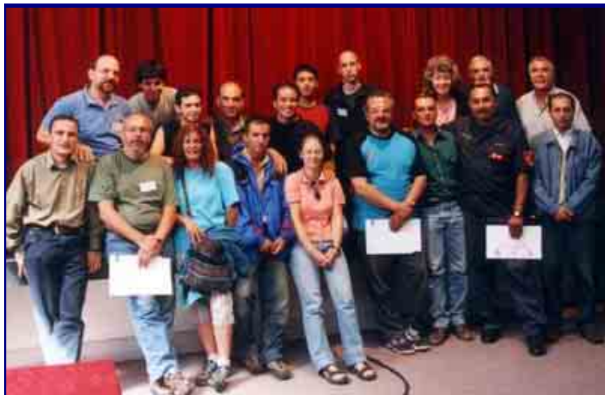
Algunos participantes en el cierre del congreso

El cierre se realizó en el Salón Auditorio del Museo con palabras a cargo del presidente de la FAdE y luego se entregaron certificados a todos los participantes. Las actas del Congreso serán remitidas a los inscriptos por correo y estarán a la venta para quienes no se inscribieron, a mediados de 2004.