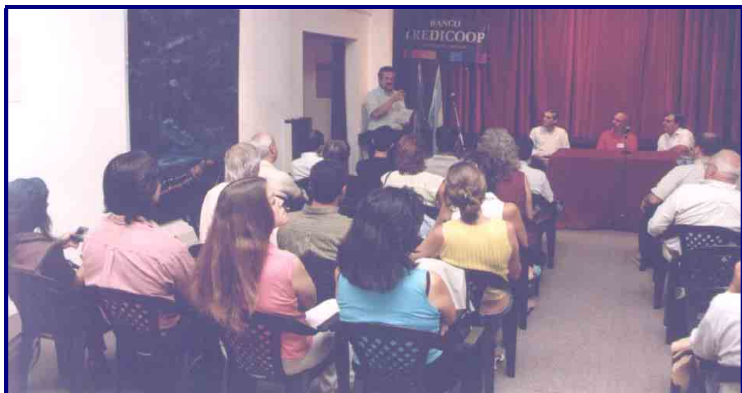
Apertura del II CONAE

El congreso fue oficialmente auspiciado por la Federación Espeleológica de América Latina y del Caribe (FEALC), por la Secretaría de Ambiente y Desarrollo Sustentable de la Nación, por el Municipio de Tandil, por la Universidad Nacional del Centro de la Provincia de Buenos Aires y por la Cátedra de Hidrogeología de la Facultad de Ciencias Exactas de la Universidad Nacional de San Juan.