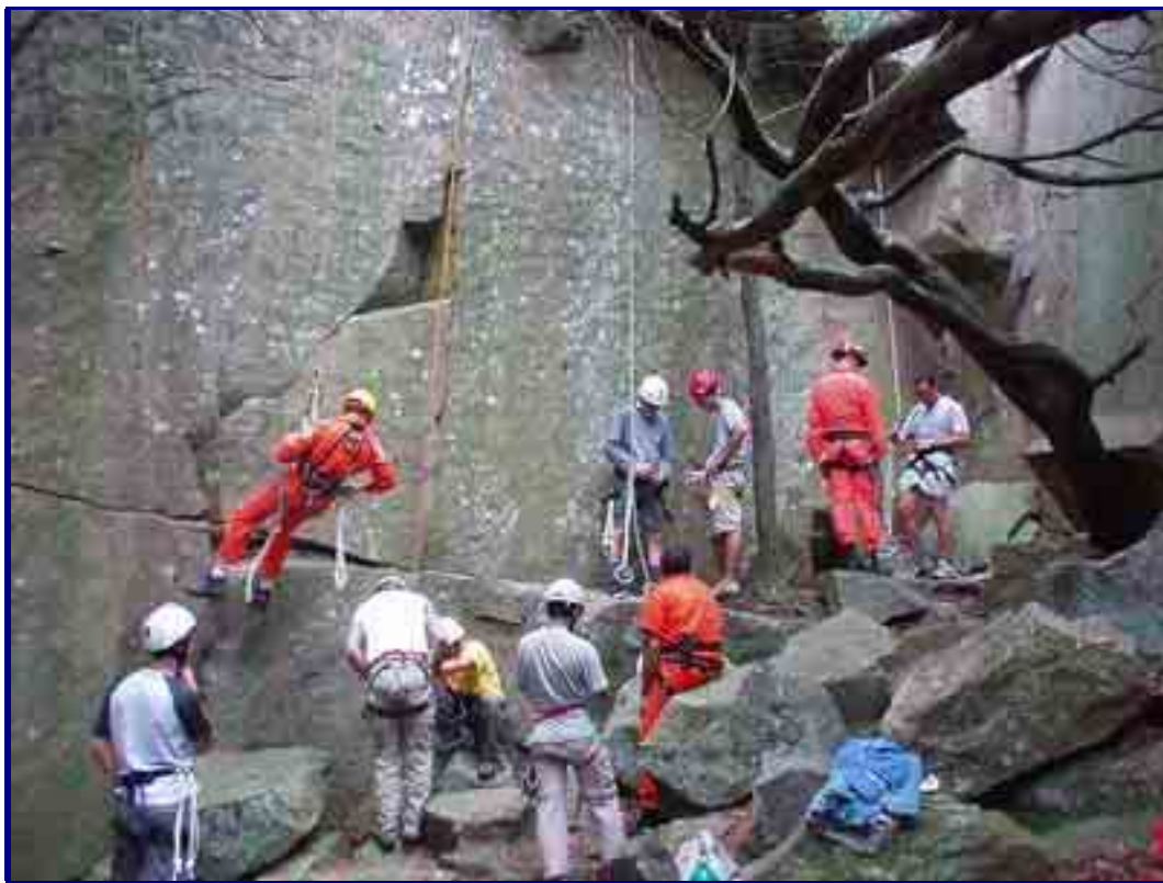
Taller de Espeleorrescate