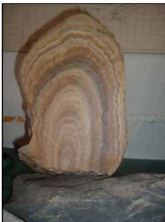
Fig. 2. Muestra de estalagmita de Las Brujas en la sede Malargüe de la DRNR