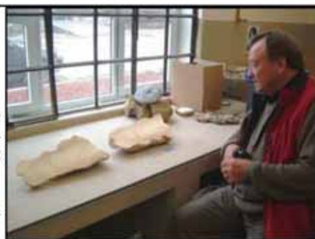
Brook en el Museo Juan Olsacher de Zapala, luego del corte de la muestra

Finalmente el día 18 de mayo nos envió el siguiente informe preliminar, que publicamos en el idioma original, para evitar errores de traducción: