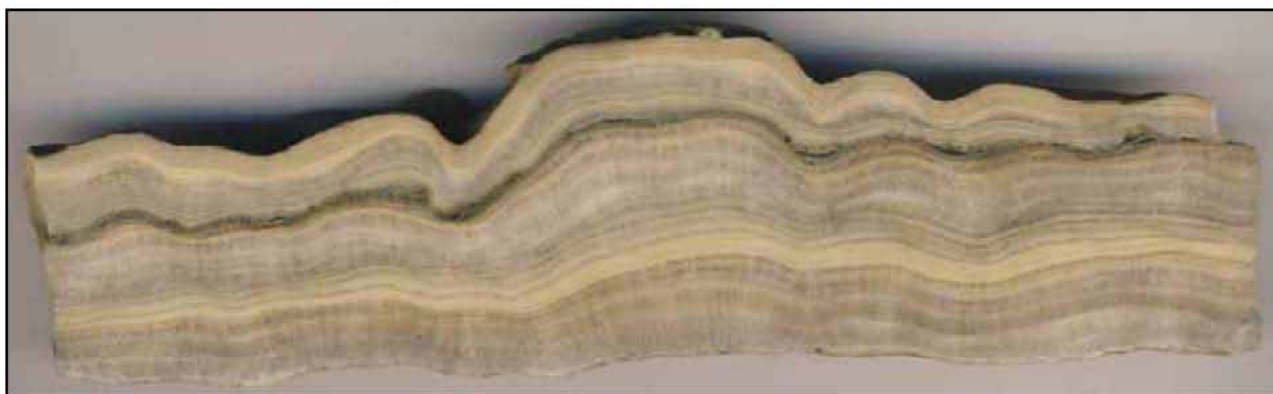
Figura 1. Imágenes de luminiscencia estimulada con rayos UV (arriba) y con reflectancia (abajo) de un depósito de travertino, de unos 3.5 cm de espesor, proveniente de un alero en el S de la Patagonia. Las capas oscuras, marrones y negras, son las ricas en carbonato con detrito.