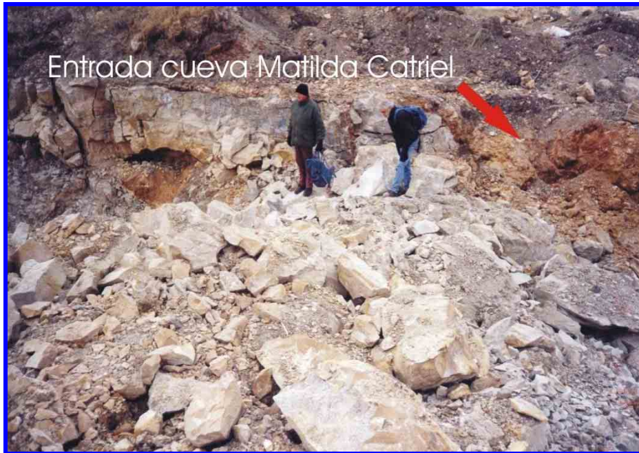
Espeleólogos de la FAdE y ciudadanos sierrabayenses observan los daños ambientales (Foto: C. Plachesi).

destrucción del techo como así también la entrada; hasta el mismo ciudadano sierrabayense que nos acompañaba quedó asombrado en qué poco tiempo habían avanzado ya que él estuvo una semana atrás y no tenía indicios de destrucción. Paso a detallar su estado: enfrente de la entrada de la cueva se encontraba una piedra de unos aprox. 2 m de alto que tenía una inscripción señalando la entrada de la cueva (decía "Piedra de la cueva del indio" . . . hoy tampoco se encuentra) la entrada está dinamitada en gran parte de la bóveda principal y en pocos días más dejaría de existir el resto: la profundidad de destrucción que tiene del nivel suelo es de unos 4 a 5 m, y siguen avanzando. Saltando entre las moles de piedras que dejaron los barrenos, donde sería el techo de la Cueva Matilde Catriel, encontramos lo que sería una parte del techo de una galería; le saqué unas fotos....".