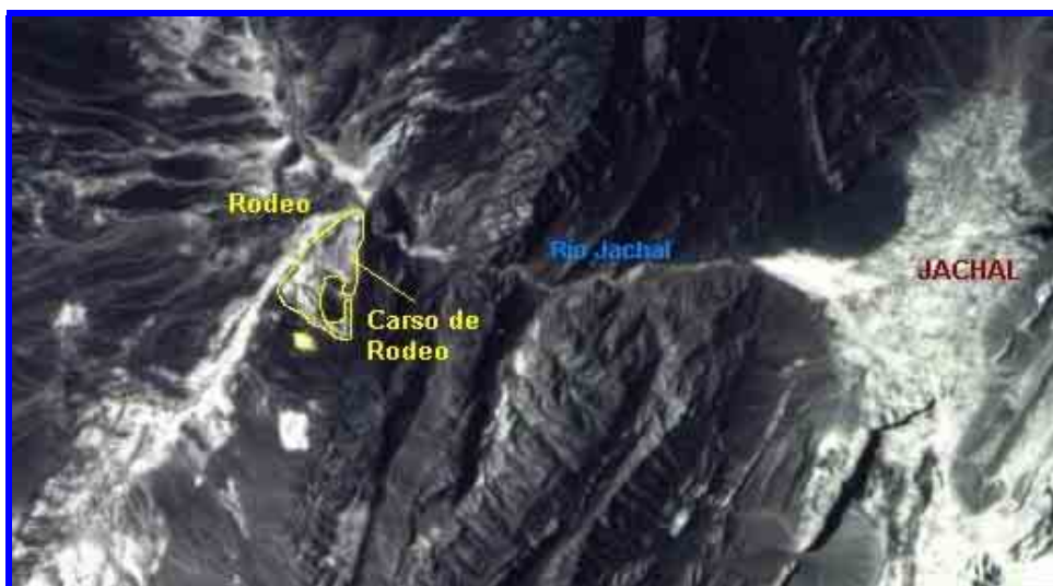
Imagen satelital del carso de Rodeo