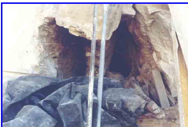
Últimas fotografías de Cueva Mallegni. La cavidad cercenada en 2001 desapareció en 2004 fruto de las voladuras.

Tenemos la certeza de tener razón, la certeza de que la Ley nos ampara, que las leyes están siendo violadas y de que no podemos permitir tanto atropello.