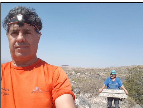
Al salir de la cueva Salamanca en Buta Ramquil, con el cartel que dice Caverna Salamanca. Más de 600 kilómetros, ida y vuelta, duró la recorrida del último día

En el último día, se visitó la Cueva Salamanca, cercana a la localidad de Nuta Ranquil, Neuquén, la cual fue hallada muy sucia y sin las medidas de protección que debería hacerle proporcionando el estado provincial. Se tomaron