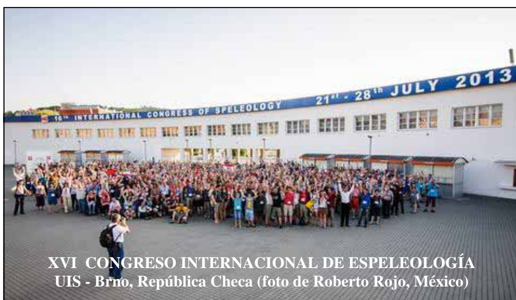
XVI CONGRESO INTERNACIONAL DE ESPELEOLOGÍA UIS - Brno, República Checa