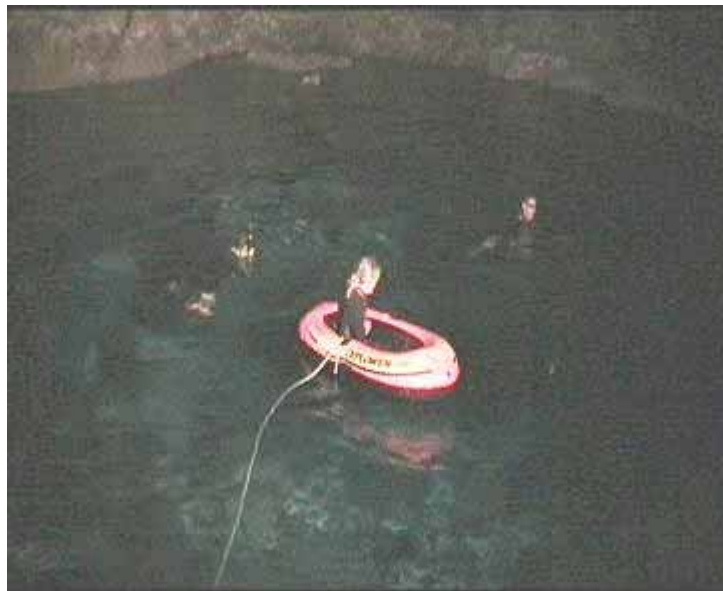
Mónica en el Lago Croacia – San Agustín