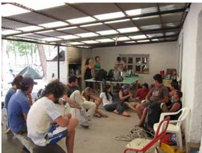
El grupo en la sección de GN