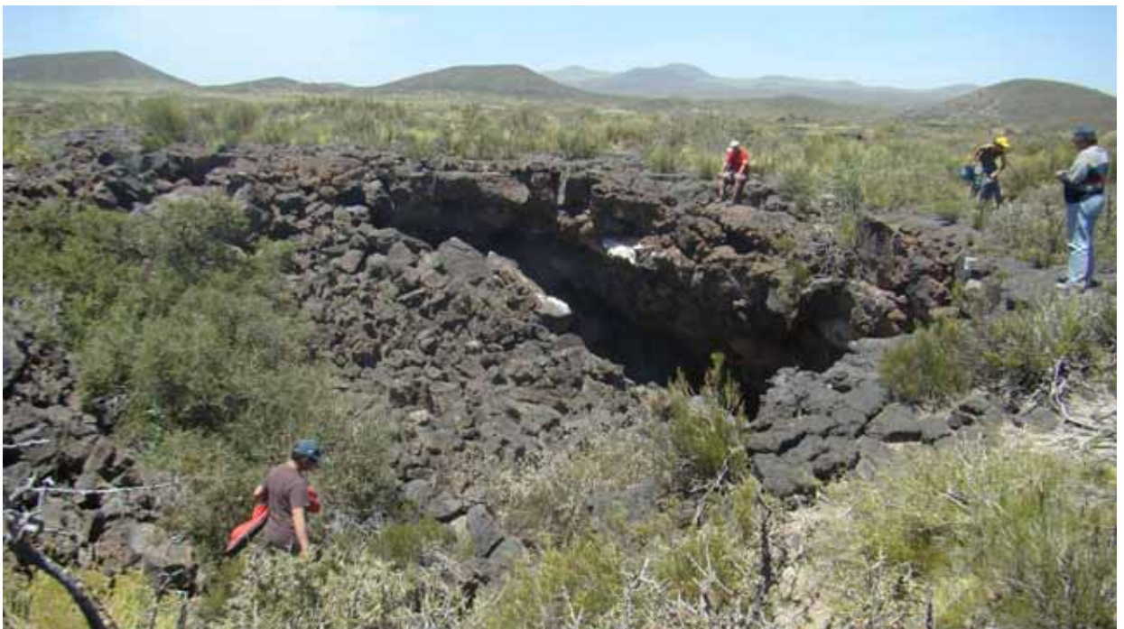
Entrada a Cueva del Borne

Los trabajos de campo duraron, el sábado 22, hasta las 23 horas. Ese día se visitaron las cuevas del Borne, Chachao y del Tigre, donde se realizaron tareas de colecta y reconocimiento de especies.